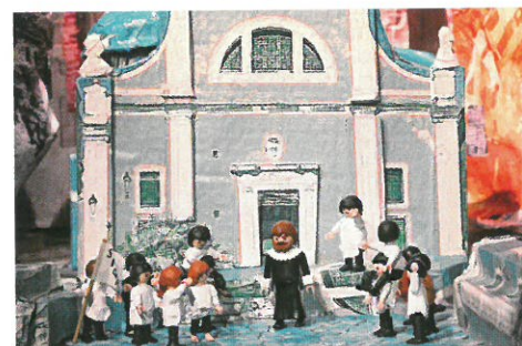
À la Maison Bonaparte, Frédéric Pierrot met en scène des scènes de l'enfance de Napoléon... avec des Playmobils.

Le 250 e anniversaire de la naissance de Napoléon Bonaparte est l'occasion de multiples célébrations et événements toute l'année à Ajaccio. Notez, par exemple, les expositions retraçant sa jeunesse à la Maison Bonaparte (jusqu'au 7 juillet), détaillant les liens de sa cousine, la princesse Mathilde, avec le monde des arts (du 27 juin au 30 septembre) ou décryptant la correspondance de l'Empereur au musée Fesch (du 14 septembre au 14 octobre). www.ajaccio.fr